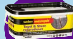
Tegel & Steen reparatie